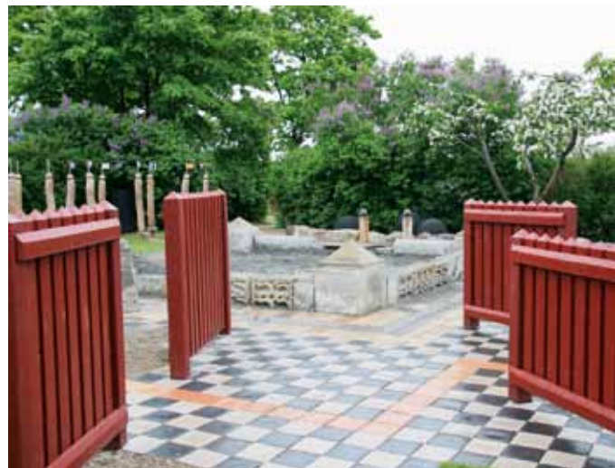
Svart- og hvitretet belegning med et rødt spor av klinker leder til styltestolpene og en rekke granittstein – Kronborgslangen. Rødmalt stakitt er et tema som gjentas fra parkens innramming.

entydig definert på forhånd og appellerer dermed til barnas frie fantasi.