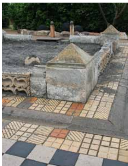
Sandkassen er en "kruttkasse" med svart sand fra Island.

Lekeklassen er i stor grad bygget av gjenbruksstein. Dels av gammel sandstein, som gjennom årene er tatt ned fra Kronborgs fasade, hvor de er erstattet med nytillhogde stein, dels av gamle granittstein og -pullerter, og endelig av små, gamle fortausklinker fra Helsingør. Dansegulvet er av nye sorte og lyse,