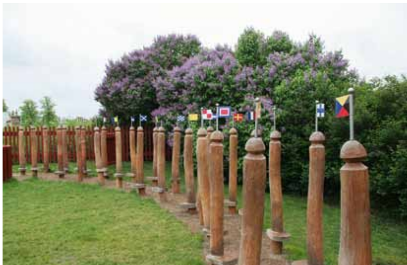
26 styltestolper med signalflag minner om at lekeområdet, omgitt av gamle syrinbusker, ligger ved Øresund.