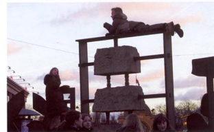
Robert Jacobsens skulptur 'De sy aksler' fra 1987 på Axeltviv i København er en populær klæteskulptur. Det er en udfordring at klæbe op 'udstille' sig selv, men hvis man falder ned - hvad ingen vist endnu har gjort - så slår man sig på granitbælgningen.