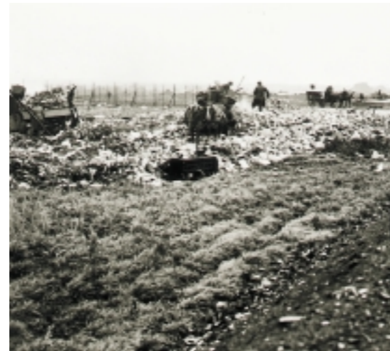
Lossepladsen på Valby Fælled, 1932.

Valbyparken er en af Københavns yngste parker. Den ligger på den gamle Valby Fælled, som var en lavliggende strandeng langs Kalveboderne. Parken blev anlagt efter at hele fælleden havde været brugt til losseplads fra 1913.